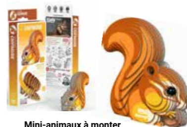
Mini-animaux à monter Assemblez, collez et admirez !