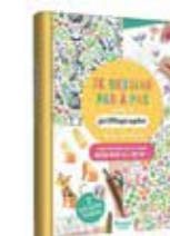
Je dessine pas à pas Un livre de dessin avec des pas à pas, mais également 2 pochoirs pour donner une variation infinie de dessins.