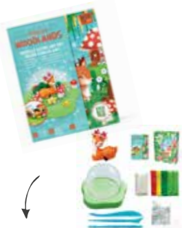
Patagom Modeler, mouler et gommer ! Créer vos propres gomes kawai avec ce kit de Patagom. (Dès 8 ans).

Globe étincelant Cet ensemble d'art enchanteur est parfait pour les jeunes artistes qui aiment la nature et les créatures des bois. (Dès 6 ans).