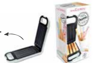
Machine "Churros factory" Réalisez d'authentiques churros, facile à faire chez vous et avec des ingrédients simples.