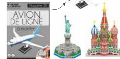
Maquettes à monter Ces coffrets vous permettent de réaliser différentes maquettes.