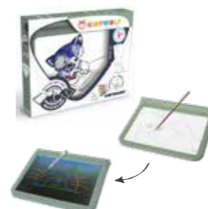
Tablette lumineuse Kidydraw D'un côté, une tablette lumineuse astucieuse: le clapet avant aimanté permet de fixer le papier, pour décalquer facilement. De l'autre côté, une face noire éclairée qui fait ressortir vos dessins avec un effet néon, et qui permet de dessiner même dans le noir. Fun !