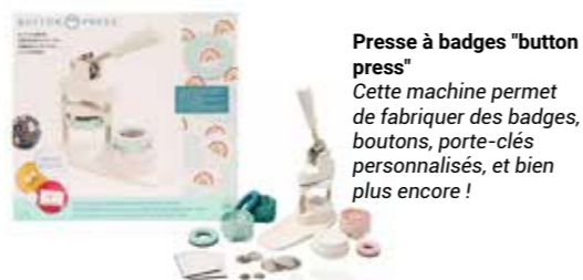
Presse à badges "button press" Cette machine permet de fabriquer des badges, boutons, porte-clés personnalisés, et bien plus encore !