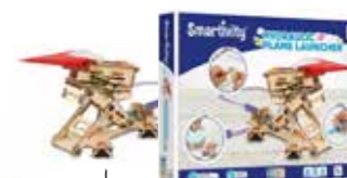
Lanceur hydrolique Envolez-vous vers le ciel avec la catapulte hydraulique pour avions en papier ou des flèches en mousse.