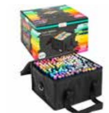
Set de 168 feutres à alcool double pointe 168 feutres dans une jolie sacoche ! Avec une pointe ronde et une pointe biseautée.