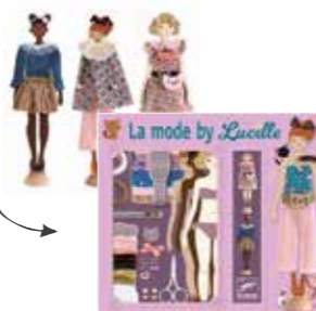
La mode by Lucille Des vrais tissus pour créer des vêtements sans même devoir coudre. Tu peux t'aider des patrons et des explications et puis laisser libre court à ton imagination. (Dès 7 ans).