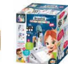
Projecteur à dessin Un projecteur pour reproduire des images et des dessins à l'infini comme un vrai artiste !