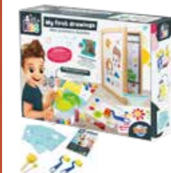
Mes premiers dessins De quoi dessiner, peindre et coller des gommettes pour développer sa créativité et sa motricité fine.