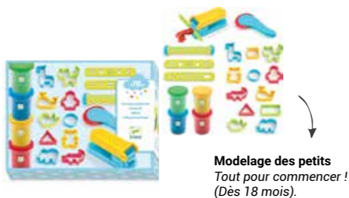
Modelage des petits Tout pour commencer ! (Dès 18 mois).

Créer avec du papier buvard Dessinez des points avec des feutres, appliquez une goutte d'eau et admirez la diffusion des couleurs sur le papier. (Dès 3 ans).