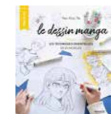
Le dessin manga Apprenez les techniques essentielles de l'art manga.