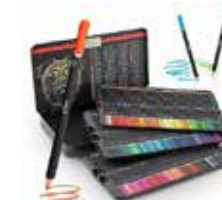
Set de 120 crayons de couleurs 120 crayons de belle qualité, aux couleurs riches et vibrantes.