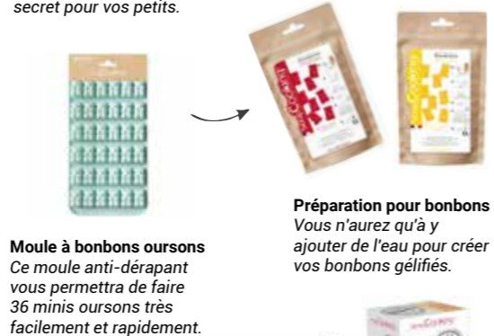
Moule à bonbons ours Ce moule anti-dérapant vous permettra de faire 36 minis ours très facilement et rapidement.