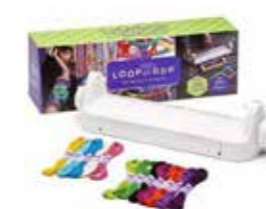
Bracelets tissés : loopedoo A l'aide du métier à tisser rotatif Loopedoo, fabriquez facilement des bracelets, colliers,... Variez les effets en changeant le style, les couleurs et l'épaisseur de votre ouvrage... Magique !