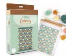
Canevas fleurs tropicales Découvrez l'art du canevas avec la technique du point lancé. Ce coffret comprend tout le nécessaire pour débuter ! (Disponible mi-novembre).