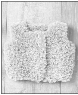
page 22 Gilet Sans Manche