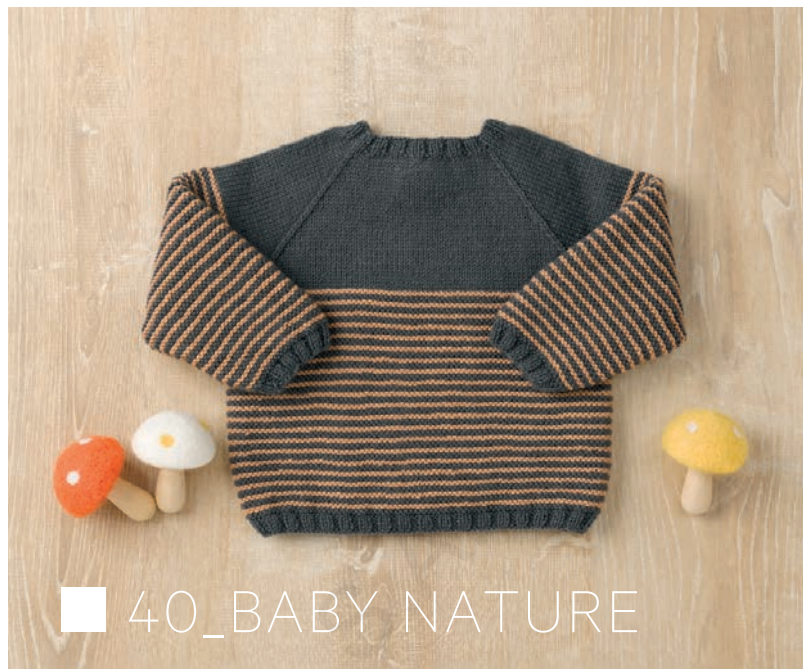
■ 40_BABY NATURE