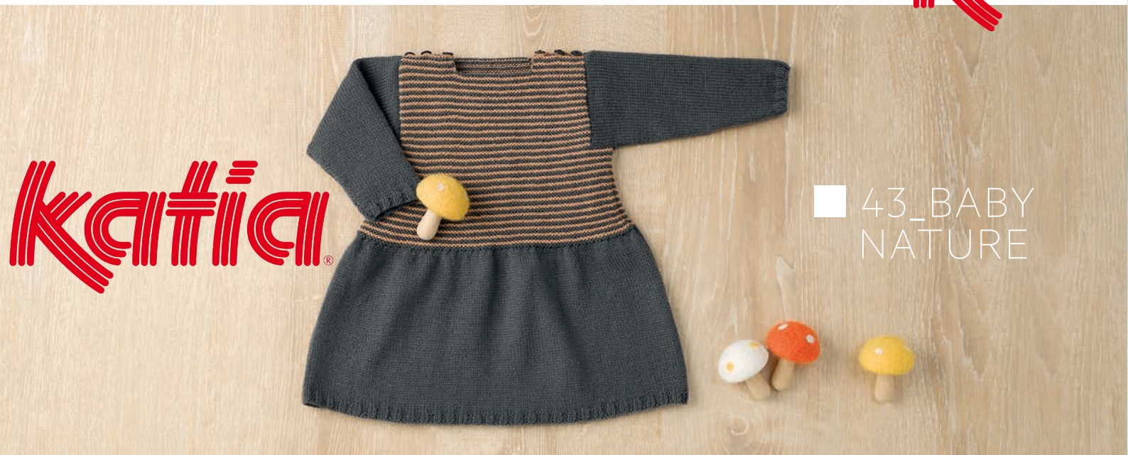
■ 43_BABY NATURE