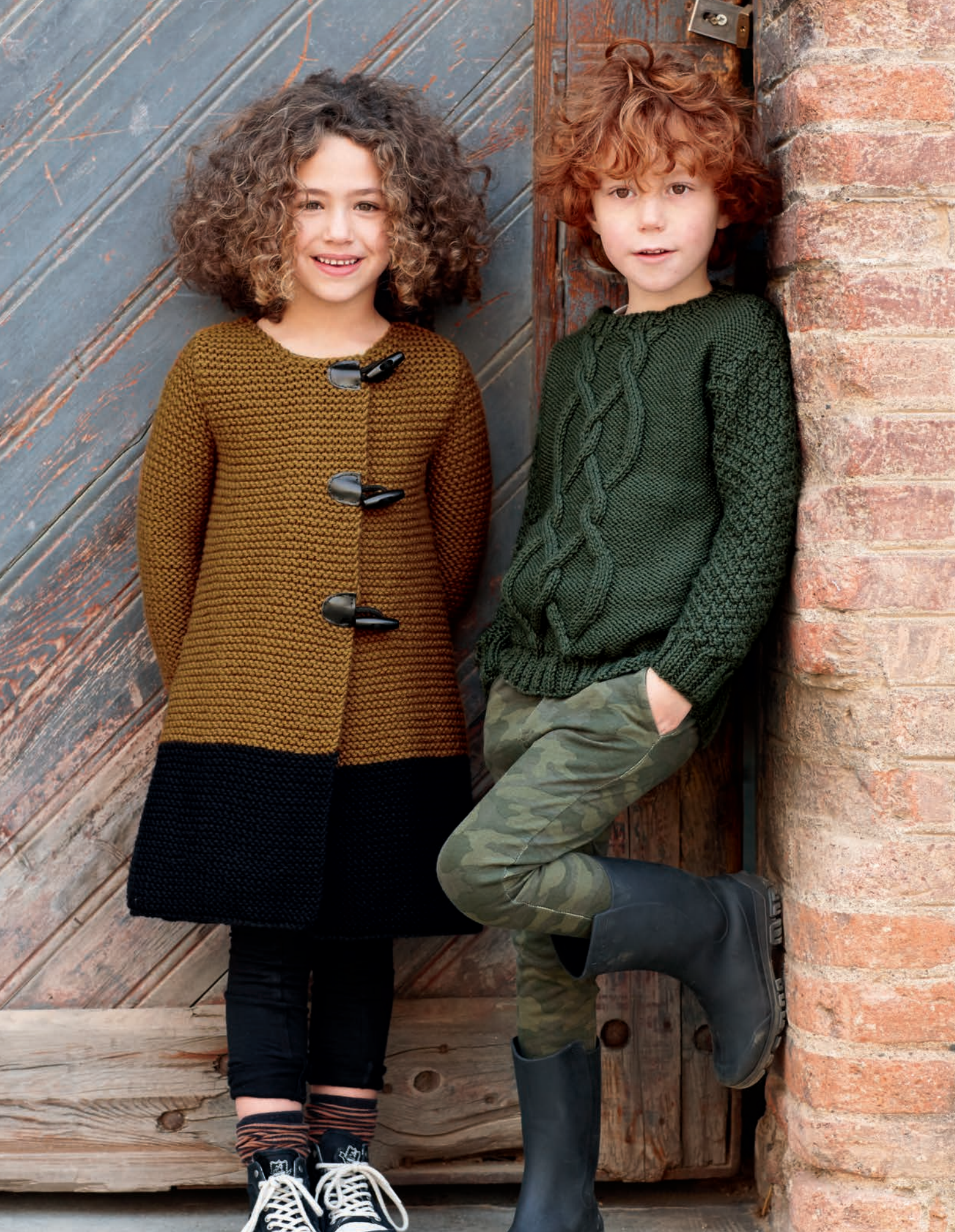
34-Maxi Merino / Norway / Merino Grosso / Peru 35-Merino Aran / Merino Sport